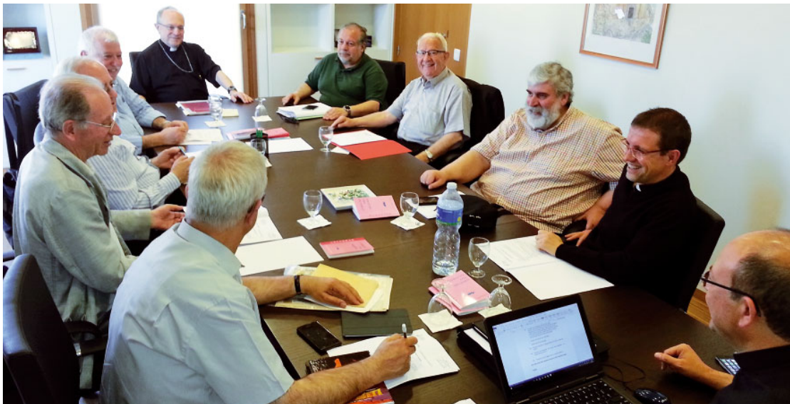
Col·legi de Consultors

stració dels béns eclesiàstics. El Col·legi de Consultors està format per alguns sacerdots (entre sis i dotze) del Consell Presbiteral, escollits pel Bisbe. Per la seva composició més reduïda i la facilitat de convocatòria, ajuda en l'assessorament al Bisbe de manera més continuada i àgil. En les reunions del mes de maig es va aprovar l'exercici econòmic de l'any 2016, un dels punts preceptius d'aquests organismes.